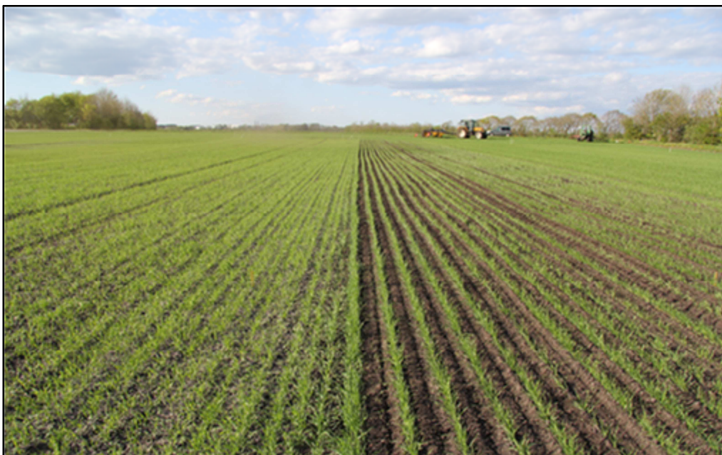
Mark med og uden radrensning